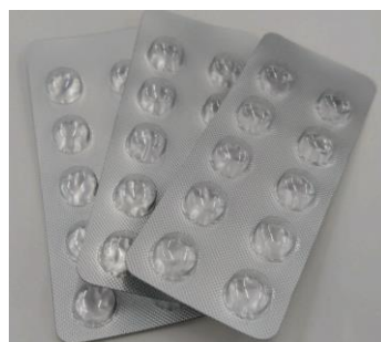
成型後の PTP シートイメージ

日本では経済産業省が 2050 年のカーボンニュートラルに伴うグリーン成長戦略を掲げ、化石資源由来プラスチックの使用を減らしバイオマス由来プラスチックへの代替を推進しています。医薬品業界では、医薬品包装資材である PTP シートに年間約 14 千トン（※2）のプラスチックが使用されており、CO 2 削減のため、バイオマス由来プラスチックへの代替が課題となっています。